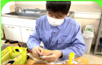
見本と比べて、良否を自分で判断する