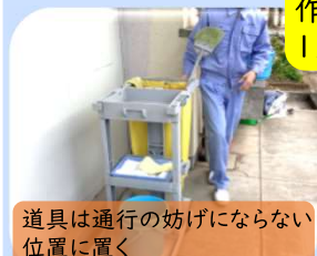
道具は通行の妨げにならない 位置に置く