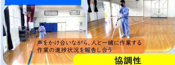
声をかけ合いながら、人と一緒に作業する 作業の進捗状況を報告し合う