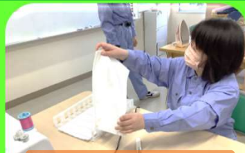
〇個できたら、自分から報告する