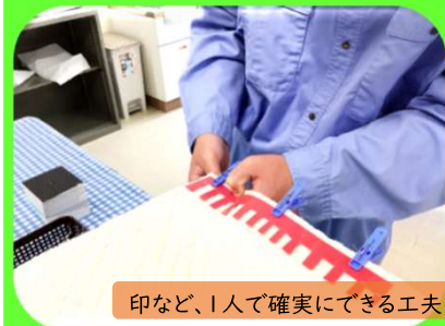
印など、1人で確実にできる工夫をしながら、時間いっぱい作業する