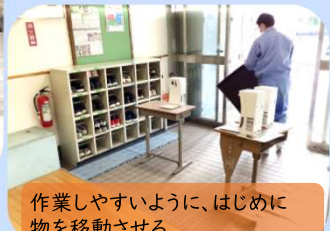
作業しやすいように、はじめに 物を移動させる