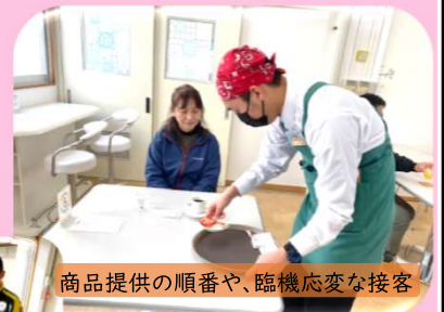
商品提供の順番や、臨機応変な接客