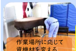
作業場所に応じて 資機材を変える