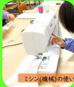
ミシン(機械)の使い方を覚えて、安全に取り組む