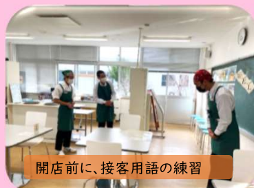
開店前に、接客用語の練習