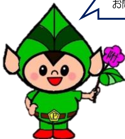
マスコットキャラクター ポプラちゃん