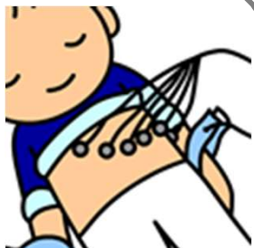
むねにつけるきぐ