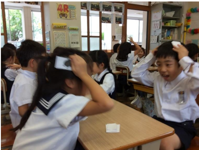
ぴったんこゲームの中では、ジェスチャーを交えながら良いリアクションをしています。