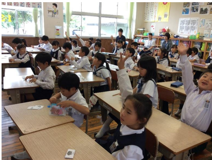
授業の始めに、英語で元気よくあいさつをしています。