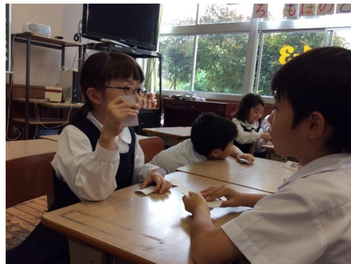
アイコンタクトを意識しながら、自分が引いたカードの動物を伝えています。