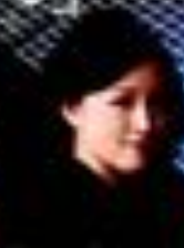
清水 ゆり子 フルート・ソプラノ