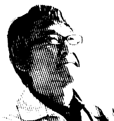
國中 均 はやぶさ2プロジェクト マネージャ

21」もリリースし、大阪と東京で記念コンサートも開催した。 2017年2月、音楽畑の楽譜集として「弦楽四重奏」、「ピアノソロ Best of Best (CD付き)」を出版。また、「弦楽四重奏」に関しては配信限定でアルバムも発売されている。 服部克久オフィシャル・サイト http://www.hatkat.com/